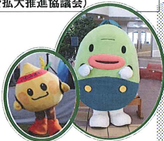
いわみちゃん ぐんぐん