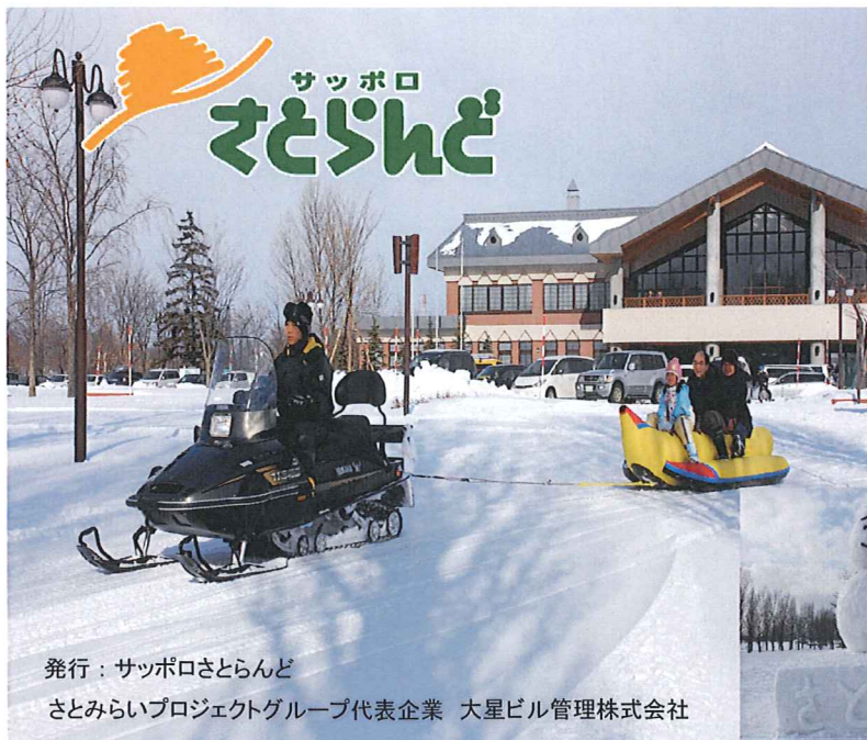
発行：サッポロさとらんど さとみらいプロジェクトグループ代表企業 大星ビル管理株式会社