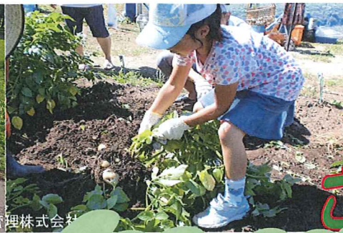
さとみらいプロジェクトグループ代表企業 大星ビル管理株式会社