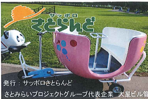
発行：サッポロさとらんど